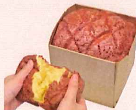
もちもちおいも メロン食パン

もちもち、ふわふわした食感と紫芋クッキーのサクサク感がマッチしたオリジナル食パン。