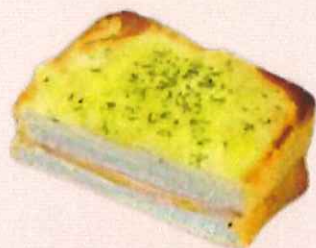
クロックムッシュ ハムチーズ

鳴門金時を使用した餡と、ホイップクリームが入ったメロンパン。サク、モチ、フワッの食感。