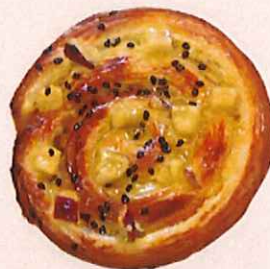
くるくるおいも デニッシュ

ご家庭でも定番のフレンチトースト。自家製のフレンチ液をたっぷり染み込ませました。