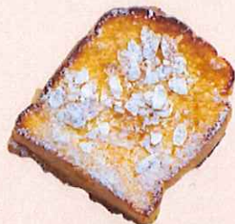
フレンチトースト

ホワイトソースに、ハムとチーズをサンドしました。ホワイトソースの濃厚さとチーズのコクをお楽しみください。