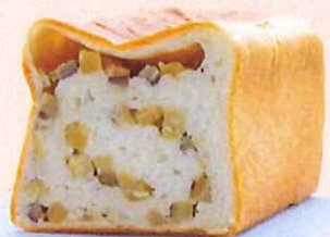
ずっしり 鳴門金時食パン

鳴門金時をパン生地約60%練りこんでおり、どこから食べても鳴門金時の味を感じられます。